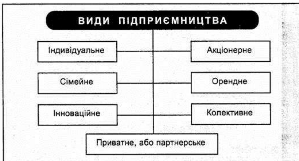
Рис. 2. Види підприємництва за формами власності та організації

За формами власності та організацією (рис. 2) можна виділити такі основні види підприємництва: